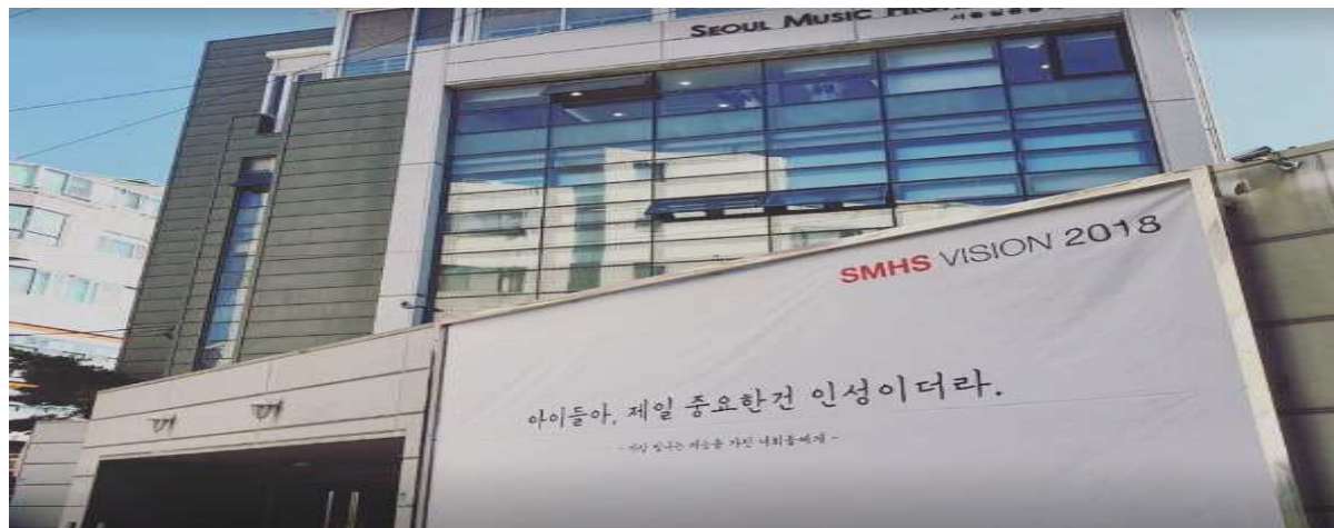
[그림 1] 서울실용음악고등학교[1]