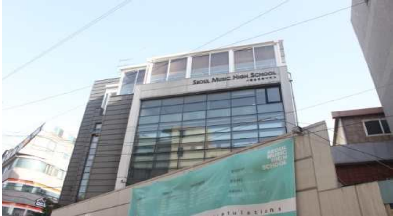
[그림7] 서울실용음악고등학교 대학 합격 현수막[1]