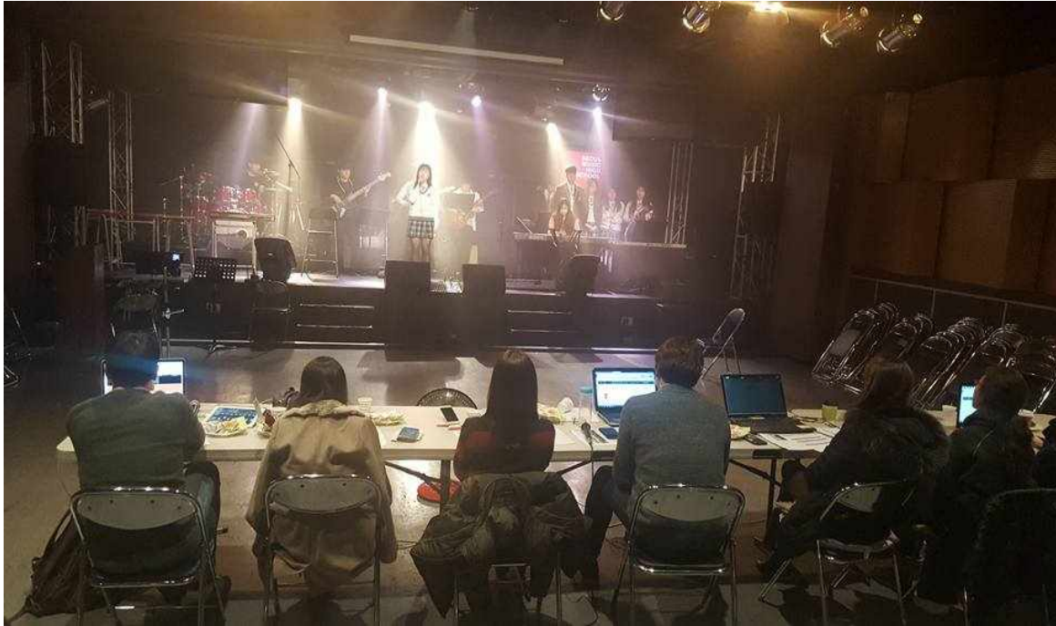
[그림 2] 2학기 연주비평 수업 학과장들 평가